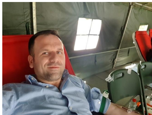
ODA EKONOMIKE E KOSOVËS